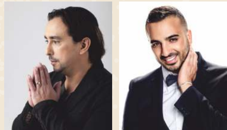
כרטיסים במחיר של 40 ₪ ניתן לרכוש בקופת המתנ"ס 08-6687001/2/7

בערב יושמעו 3 פיוטים שנכתבו במיוחד לפסטיבל העשור.